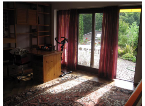
Zimmer EG Zugang Garten