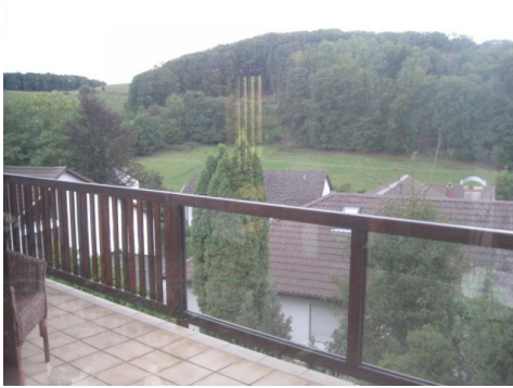
Aussicht vom großen Balkon