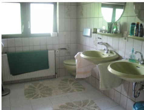
eines der Badezimmer