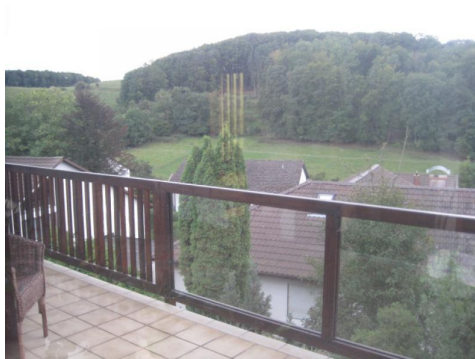
Aussicht vom großen Balkon