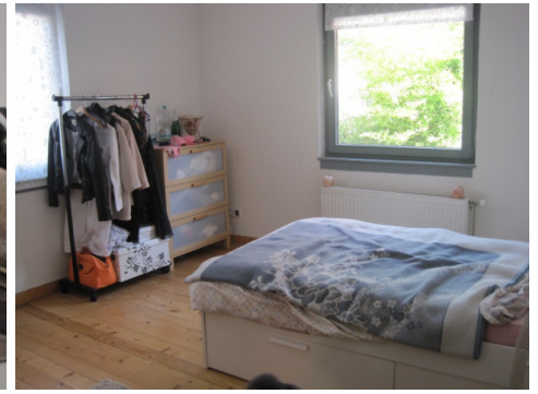
eines der Schlafzimmer